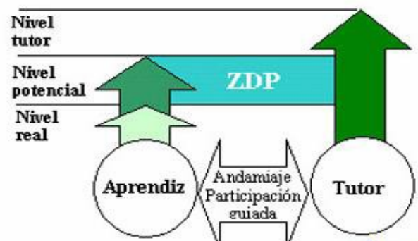
La diferencia entre el nivel real de desarrollo para resolver un problema con autonomía y el nivel de desarrollo potencial (bajo la guía de un tutor).

Las aportaciones de estas corrientes psicológicas y de las pedagógicas, anteriormente descritas, indiscutiblemente, han sido determinantes en la definición y planteamiento de nuestro actual Sistema Educativo,